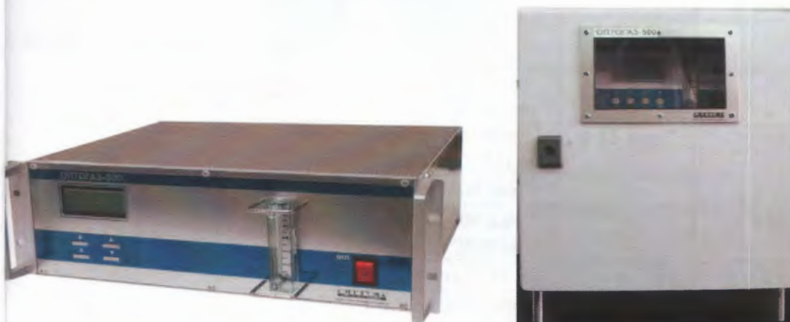
Рисунок 2 - Газоанализатор «ОПТОГАЗ-500» стационарный, стоечное исполнение